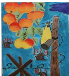
Сания Әбен 9 «Е» сынып оқушысы