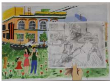
Айерке Сейтқали 9 «С» сынып оқушысы