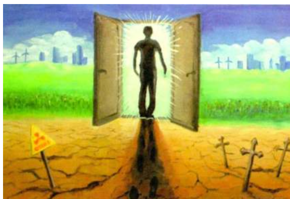
«Қасіреттен жаңа әлемге» Калбаева Гүлшат, 7 «С» сынып оқушысы